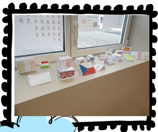
LES PRISMES- DRAPEAUX EN MATHÉMATIQUES

En mathématiques les élèves ont également travaillé sur les prismes qui devenaient alors de nouveaux porte drapeaux aux couleurs de l'Europe.